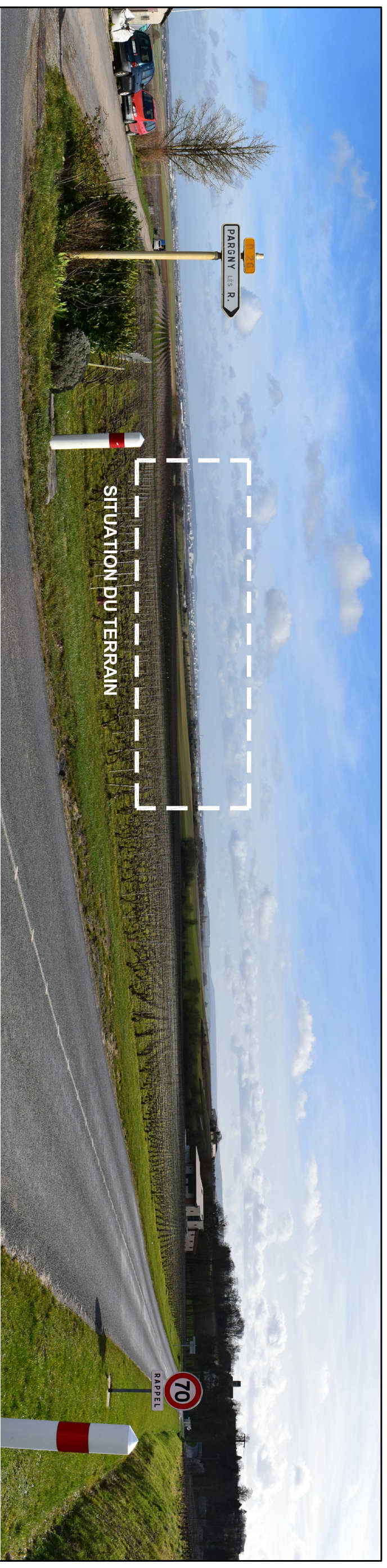
VUE PC8 a